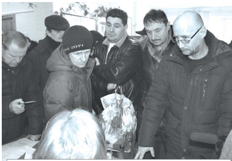
Информация о вакансиях, предоставленная ЗАО «ФМ Логистик Восток», во многих присутствующих на ярмарке ярцевчан вселила надежду на то, что полученная в этой фирме работа улучшит финансовое положение их семей.