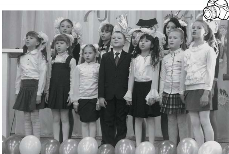
70-ЛЕТИЮ КАПЫРЕВЩИНСКОЙ СРЕДНЕЙ ШКОЛЫ было посвящено торжественное мероприятие. С этой знаменательной датой учеников и преподавателей пришли поздравить высокие и почетные гости. И сами школьники порадовали всех присутствующих концертными номерами.