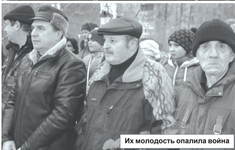
Их молодость опалила война

15 февраля по традиции, сложившейся за последние годы, у памятника воинам-интернационалистам собрались ярцевчане разных поколений.