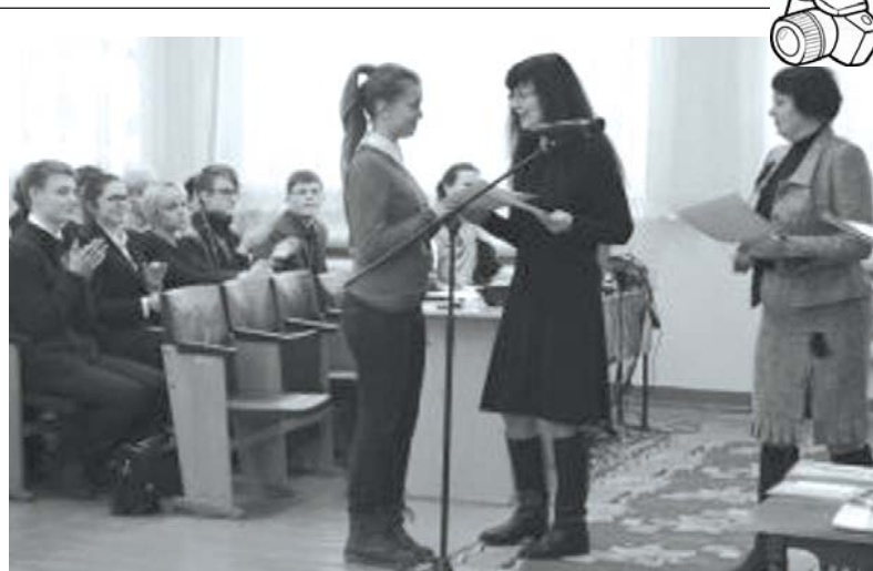
ЦЕРЕМОНИЯ НАГРАЖДЕНИЯ победителей и призеров муниципального этапа Всероссийской олимпиады школьников состоялась в школе-гимназии. В нашем районе в предметных олимпиадах участвовало 418 школьников; из них 26 стали победителями и 93 - призерами.