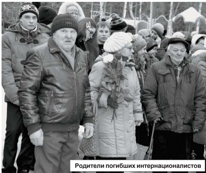
Родители погибших интернационалистов