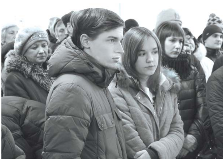
В настоящее время особенно трудно найти подходящую работу вчерашним выпускникам ярцевских школ и студентам-заочникам, которые еще не успели приобрести профессию и производственный опыт.

Четырнадцатичасовой режим работы женщин явно не устраивал.